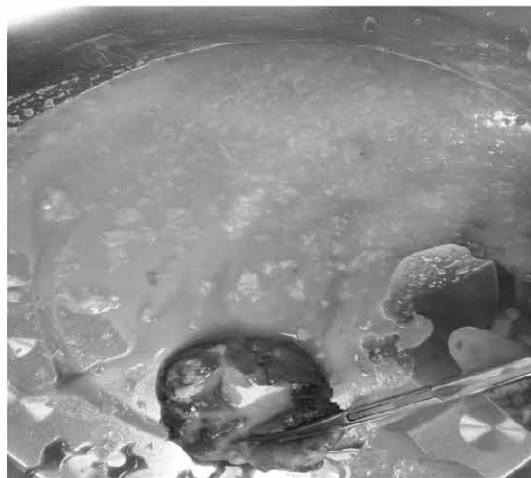
图 3 剖开后囊内容物